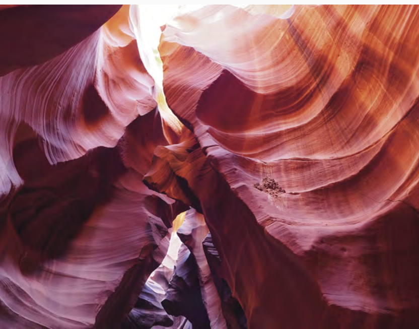
E-M5 Mark II + M.ZUIKO DIGITAL ED 12-40mm F2.8 PRO 1/1.3sec. F5.0