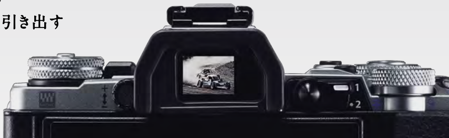
超大型236万ドット高精細ビューファインダー

よりシャープで高精細な一枚を手に入れる。 OM-D E-M5 Mark IIの能力を最大限に引き出す 12-40mm F2.8 PROキット、新登場。